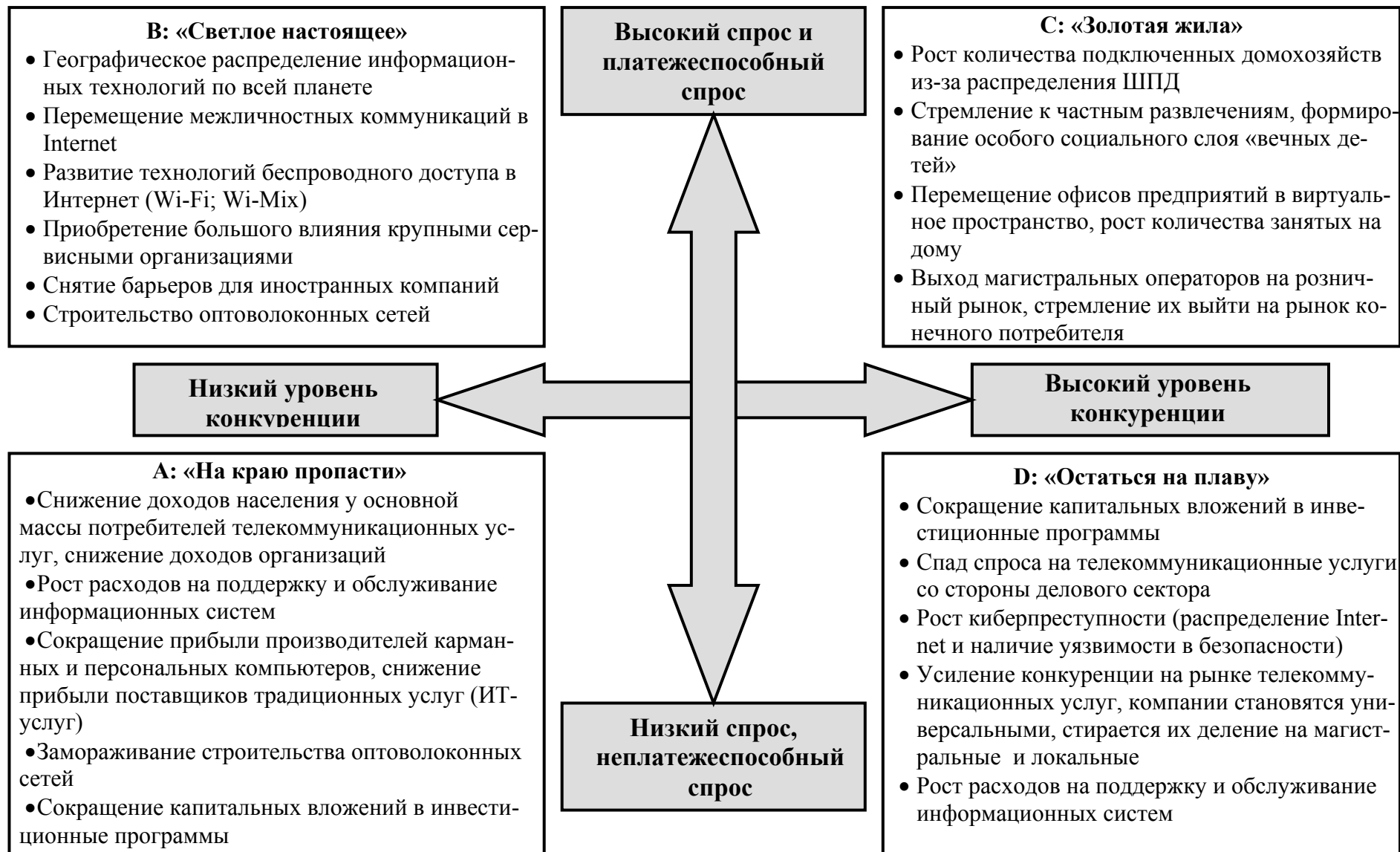
Рис. 3. Четыре сценария развития телекоммуникационной отрасли